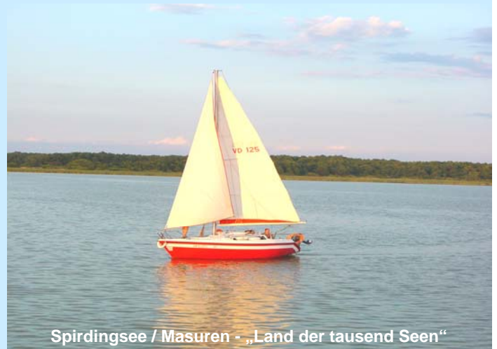
Spirdingsee / Masuren - „Land der tausend Seen“

Zudem warten 2006 viele beliebte Reiseziele zu echten Traumpreisen auf Sie. Dabei wurde das Unternehmen den wiederholten Kundenwünschen gerecht, die nach mehr Reisen mit einer Reisedauer zwischen ca. 12-16 Tagen fragten. Vorinformationen ab sofort möglich (auch unverbindliche Vormerkungen für 2006) – das komplette neue Programm 2006 kann ab Caravan Salon Düsseldorf 2005 angefordert werden.