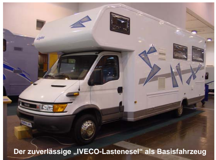
Der zuverlässige „IVECO-Lastenesel“ als Basisfahrzeug

Der Iveco Daily. Eines vorab: Er ist für manchen erst etwas gewöhnungsbedürftig, da er ein recht „rauer Bursche“ ist und nicht