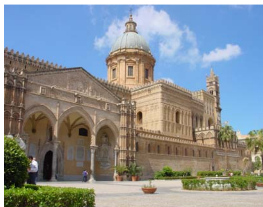
Kathedrale in Palermo

Reisenden empfiehlt sich, übrig gebliebenes Geld rechtzeitig umtauschen. In den wichtigen Feriengebieten wird vielerorts auch der Euro als Zahlungsmittel akzeptiert.